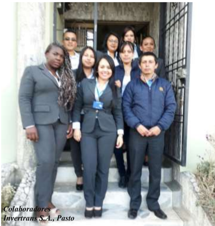
Colaboradores Invertrans S.A., Pasto

“Amplia oferta laboral transportadora; si bien existen muchos transportadores, esto complica mantener un adecuado control de la selección, sin embargo, son ellos los mayores conocedores de la ruta; y es precisamente, a través de esa selección, que nos permite estar atentos a uno de los riesgos más significativos que es el control vehicular”.